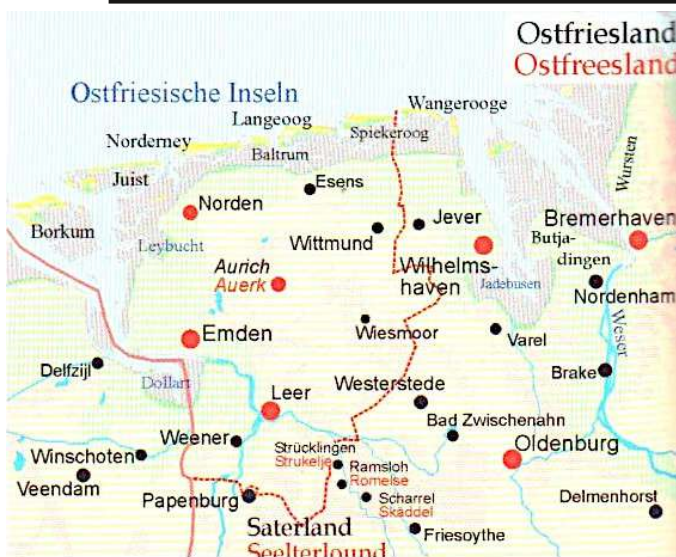
Kaartsje fan East-Fryslân (Ostfriesland/Oostfreesland/Aastfrâislound) en omkriten (boarne: De Fryslannen, Fryske Rie/Afûk , 2008, s. 66).