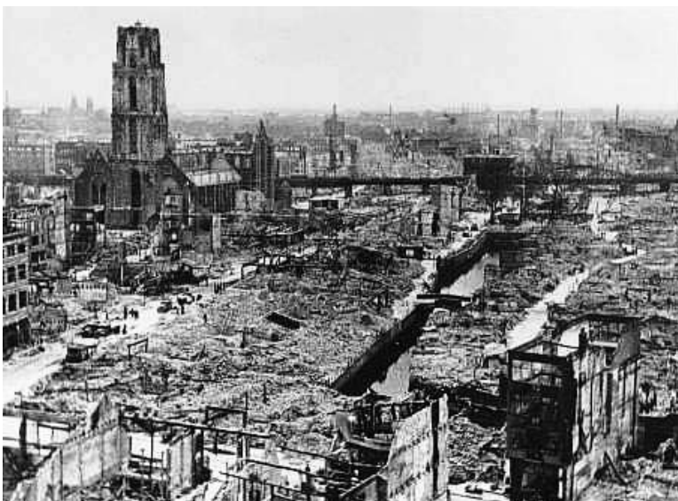
Emden nei it bombardemint yn 1944

Leer 10 hat in lange skiednis. Yn it jier 791 stifte de Fryske misjonaris Liudger 11 dêr de earste tsjerke fan East-Fryslân. It grutste evenemint fan East-Fryslân fynt jierliks plak te Leer en is de saneamde Gallimarkt . Dat wurdt alle jierren troch in heal miljoen minsken besocht. De Gallimarkt begjint op de 2 de woansdei fan oktober mei in feemark, de grutste fan Noard-Dútslân, dêrnei is der merke en alles mei-inoar duorret it 5 dagen. Leer hat in moaie âlde binnenstêd ('Altstadt'). Der is in nijsgjirrich Heimatmuseum , ûnderbrocht yn twa âlde gebouwen. Men kin der moaie dingen út eardere tiden bewûnderje, lykas meubels, diggelguod en skilderingen en dêr is ek de lêste houten East-Fryske tsjalk te sjen.