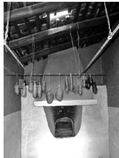
Spek op 'e deizen.