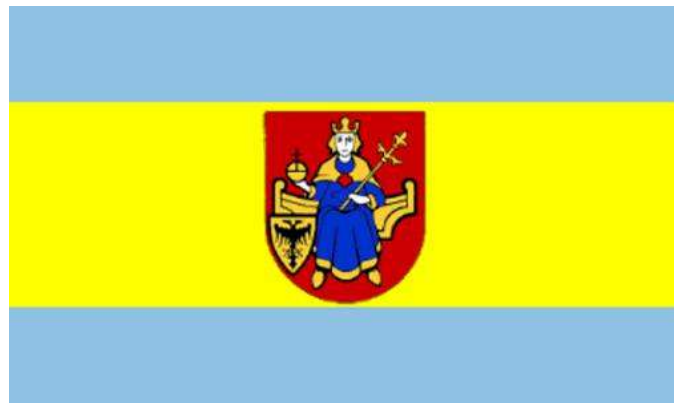
Flagge fan de gemeente Sealterlân (Landkreis Cloppenburg yn de Dútske dielsteat Nedersaksen).

Yn Sealterlân praat sa'n 14 persint fan de befolking