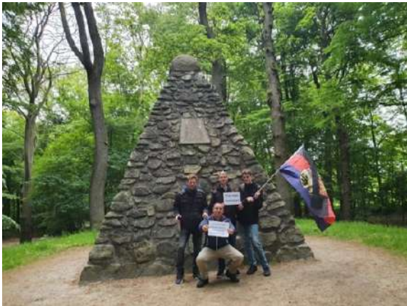
De Jongfriezen litte ús witte dat de 'eigen' talen folle mear brûkt wurde moatte yn de taspraken by de Opstalsbeam te Au(w)erk ( 30 maaie 2023,).