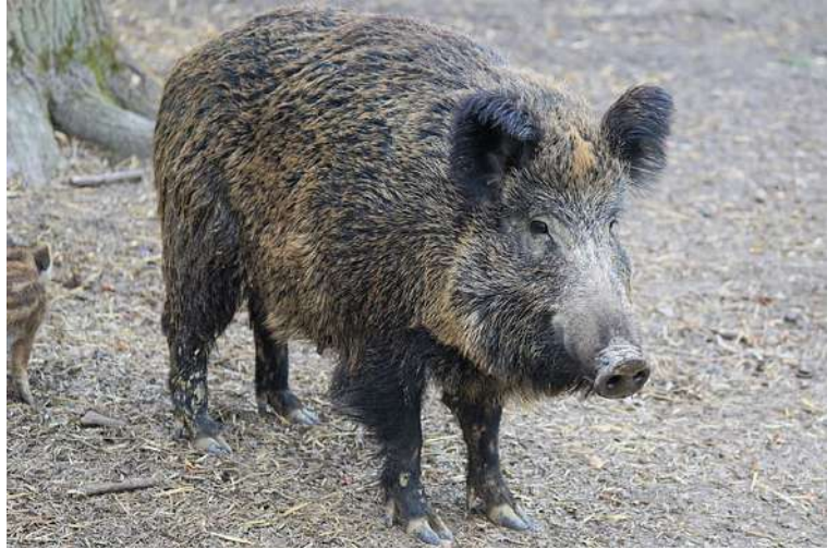
Oant hjoed-de-dei is bargefleis foar in sus en in leur te keap yn Portugal.

A l sitte we sa'n fyftich kilometer streamop fan 'e riviermûning ôf, wy hawwe hjir noch altyd de ynfloed fan eb en tij ... mei in fertraging fan goed trije oere. Dy trankyl pulsearjende 1 beweging sit de lju hjir ek wat yn it bloed – de wrâld leit harren wol sljocht. Dat hat neffens my ek wat mei it moarske komôf te meitsjen. Wy hawwe yn it Westen noch de yllúzje dat wy ús lot yn eigen hân hawwe ... as we der mar boppe-op sitte. De profeet Mohammed wie lykwols fan betinken: it hat neat gjin sin en rin jins lot nei, want jins lot rint jin wol nei . Dy yn westerske eagen wat fatalistyske libbenshâlding fynt men teffens werom yn de hertsearige Portugeeske muzykfoarm fado (= lot).