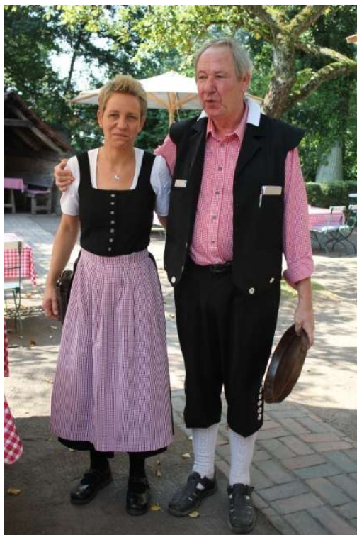
Obers yn Ammerländer klaaiïng.

De ûnôfhinklike status duorre oant 1744, doe't greve Karel Edzard Cirksena (1716-1744) sûnder bern stoar en East-Fryslân, ynklusyf Emden, ynlive waard troch Prusen. Yn 1944 waard Emden swier bombardearre troch Amerikaanske fleantugen. De histoaryske binnenstêd gie foar in grut part ferlern. Wol is yn de stêd noch altyd de midsiuwske binnenhaven, de Ratsdelft , te finen. Yn en om dy haven hinne fynt men wichtige gebouwen lykas it stedhûs, inkelde musea, in âlde havenpoarte en âlde boaten. Nei de Twadde Wrâldoarloch is Emden wer opboud. Yn it Ostfriesische Landesmuseum fan Emden is in unike kolleksje tentoansteld. Hert fan de kolleksje is de 'rust'-keamer (wapenromte) mei syn 400 jier âlde swurden, musketten en harnassen. Oare at-traksjes binne in kolleksje fan Nederlânske skilderijen, it feanlyk fan Bernuthsfeld en de sulverskat fan Emden.