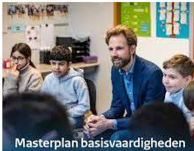
Minister Dennis Wiersma (1986, Frjentsjer; op de foto yn 'e midden) is begjin 2023 noch minister foar Primêr en Fuortset ûnderwiis en besiket dan ek Fryslân.

Hoe moat dy besite oan de skoalle op 'e Jouwer no ynterpretearre wurde? In sjarnebesite yn ferkiezingstiid? It lanlike taalbelied yn de lêste fyftich jier is twaslachtich. Op regearingsnivo wurdt praat oer dat moaie Frysk, mar yn regeljouwing, ûnderwiis en it iepenbiere libben wurdt de taal yn in efterstâns situaasje holden. In