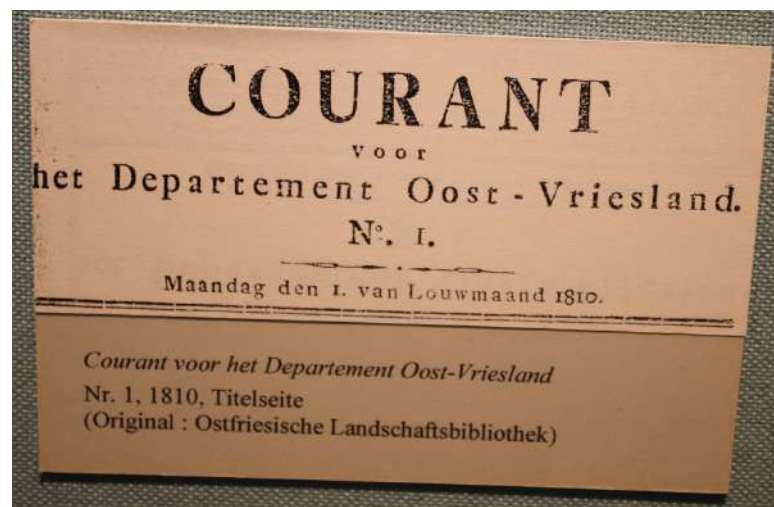
Krante út de Napoleontyske tiid yn it Historisches Museum Aurich.