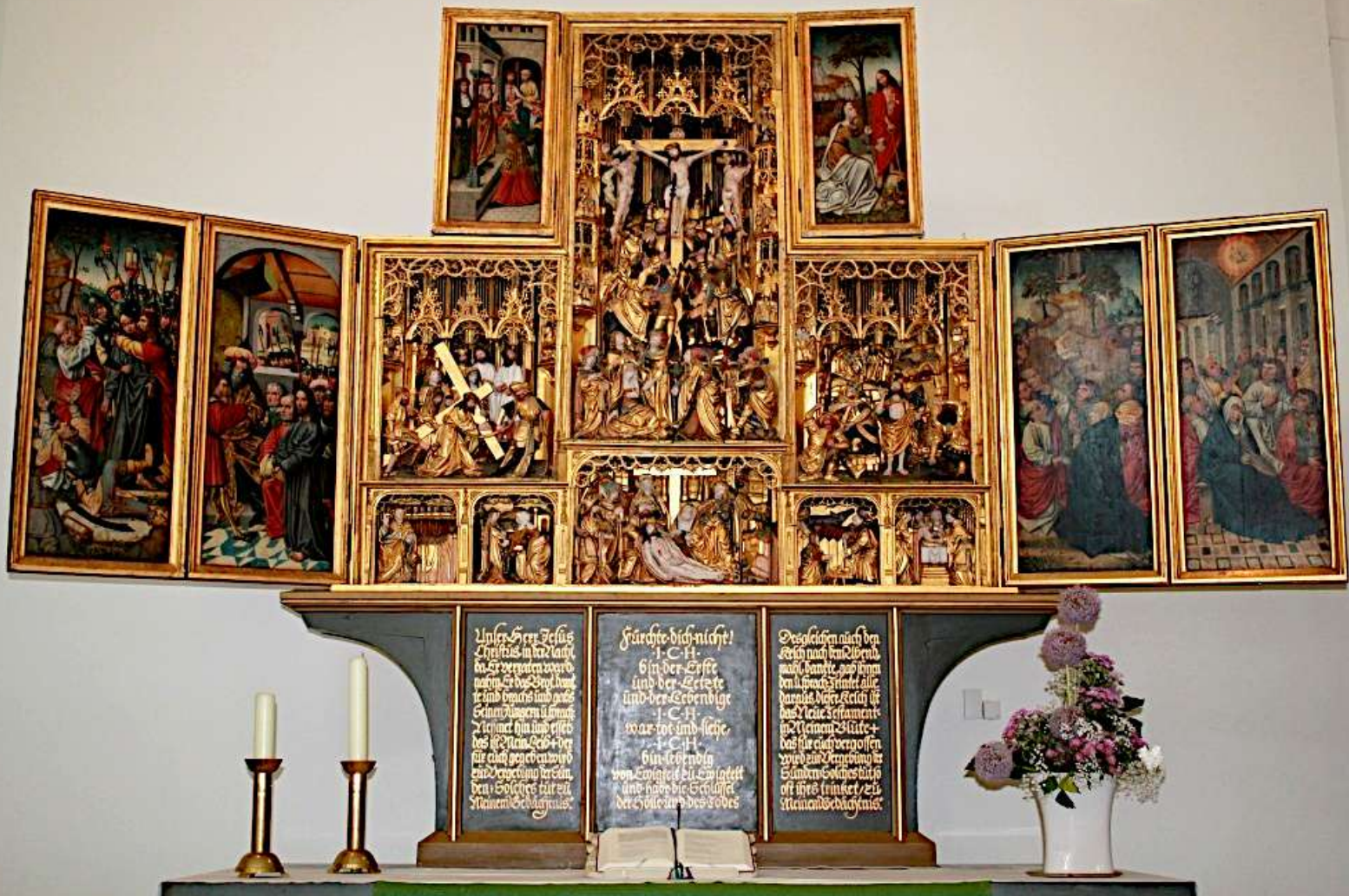
It prachtige Ihlower alter fan de Lambertitsjerke yn Aurich.

meitsjen. Oant greve Karel Edzard Cirksena yn 1744 stoar, hat de famylje Cirksena altyd oan 'e macht west yn East-Fryslân. Dêrnei foel East-Fryslân yn hannen fan Prusen.