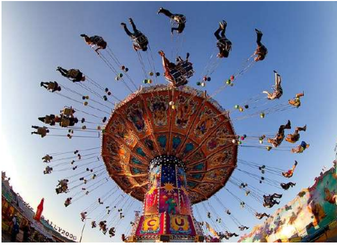
De merke op de Gallimarkt yn Leer.